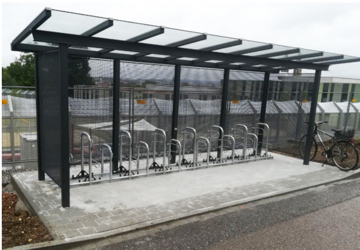
Sedura XXL med bak och sidopaneler av perforerad plåt samt lackerat i RAL kulör.